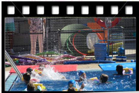
Clases de Natación