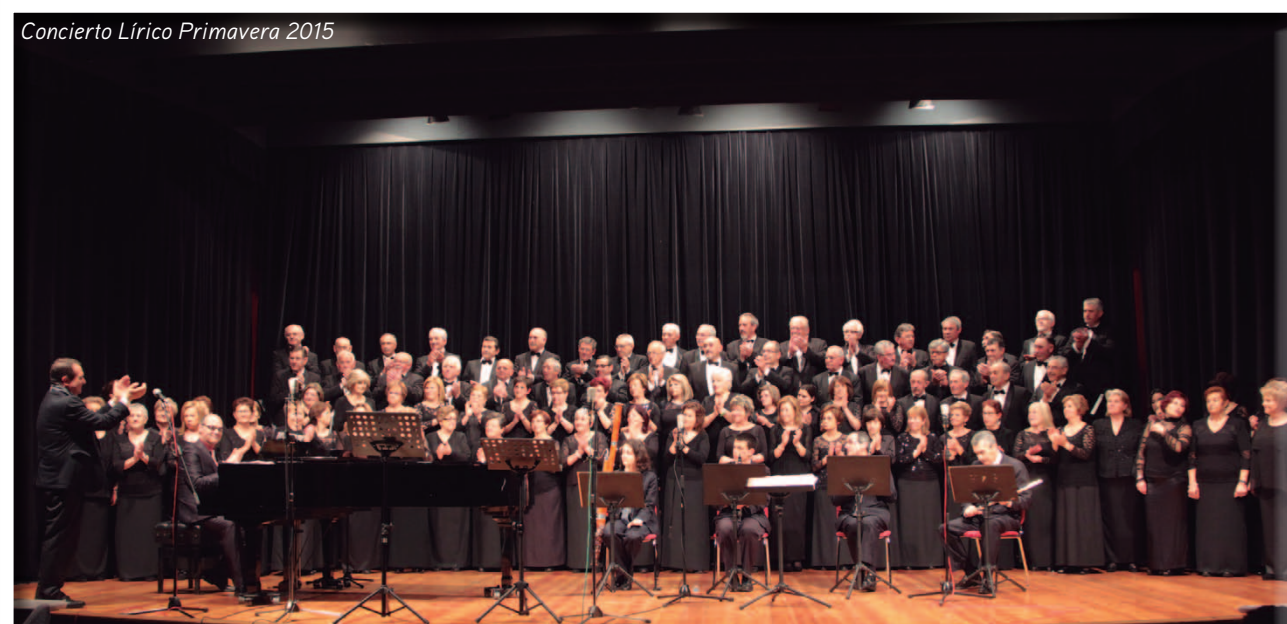
Concierto Lírico Primavera 2015

El aforo completo en los conciertos Líricos realizados y la gran acogida por los asistentes, nos animan a continuar en el 2016.