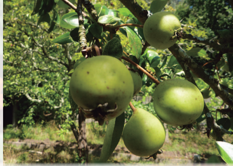
Peras de San Juan

pranas ha sido muy gratificante. El próximo año repito. De la cosecha principal he terminado hoy las últimas. Han servido para hacer unas bravas. Ya esta semana empezaré a levantar las de esta temporada. ¡Para qué gimnasio!