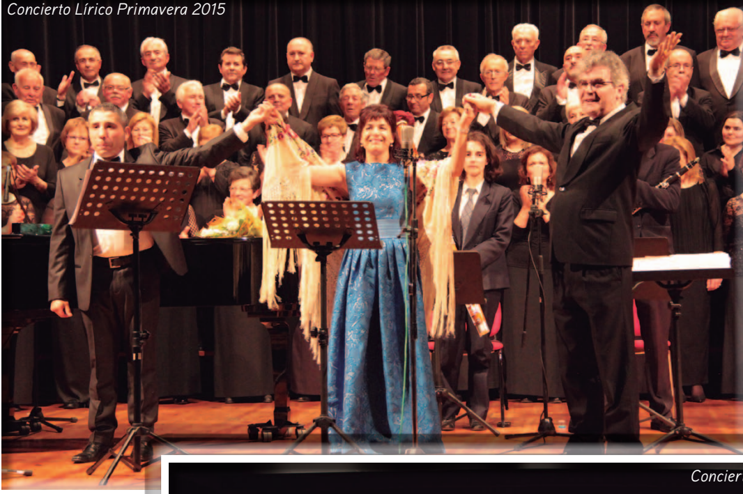
Concierto Lírico Primavera 2015