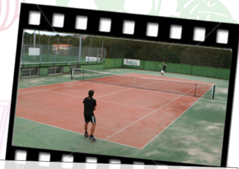
Escuela de Tenis