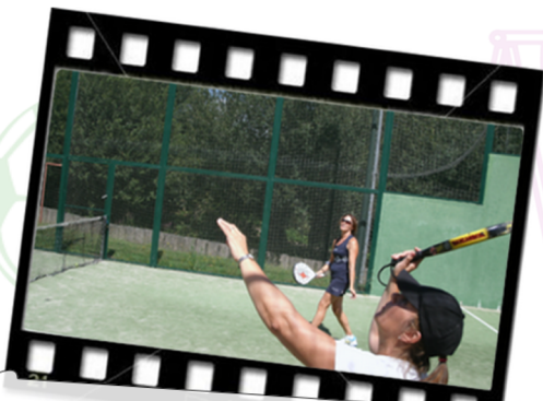
Escuela de Padel